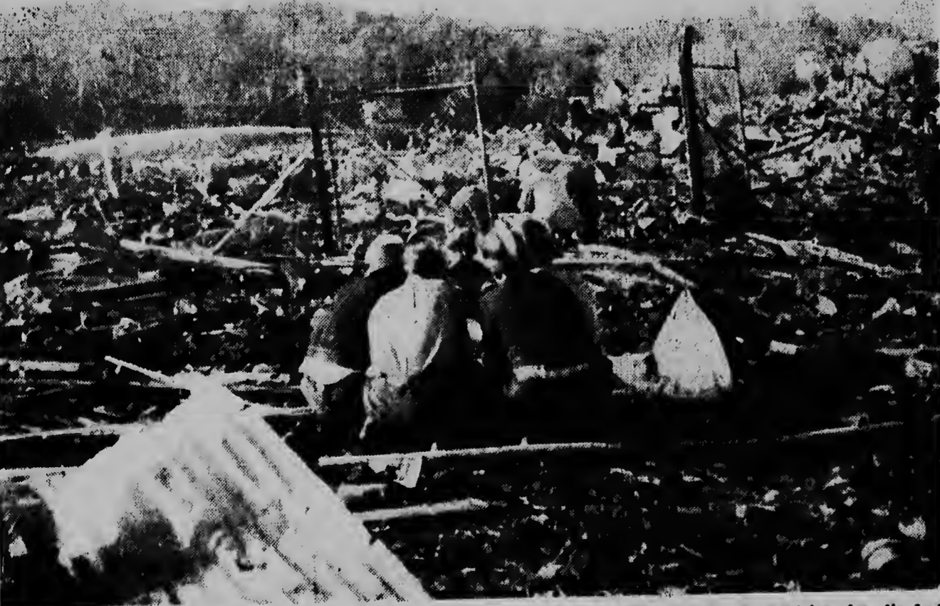
Na noord di Norwega, banda di Narvik, a sosode un explosion gigantesco. Un deposito di municon den dje fortif „Trondenes“ a bula bai laria. Riba e foto ta keda e hendenan di salvamento na momento cu nan ta drentando e territorio caminda e explosion a tuma lugar. Rondo di nan tur loka a keda ta desastre y destruccion....